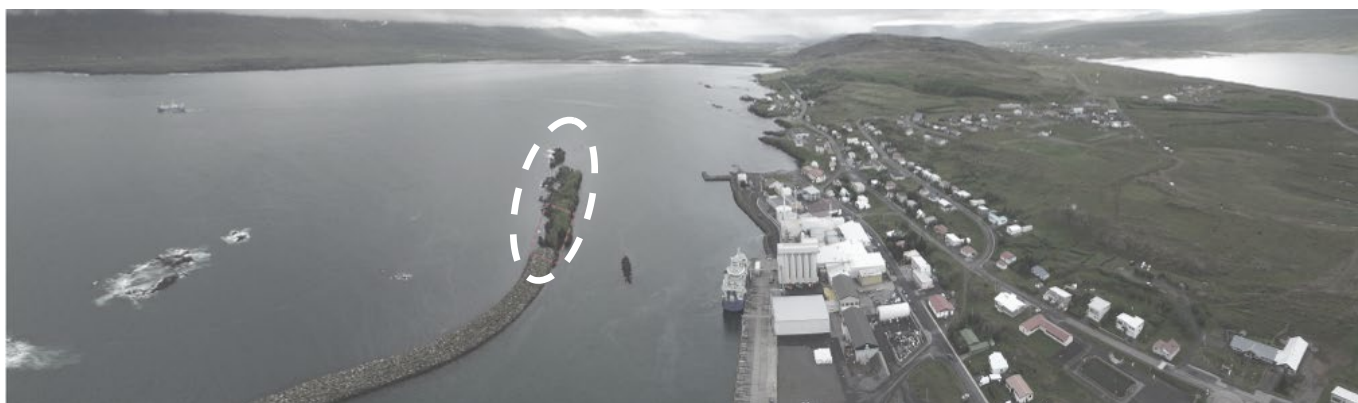
Mynd 2.1 Horft inn Vopnafjörð. Skiphólmi er fyrir miðri mynd en varnargarður gengur frá landi og út í hólmann.

Í aðalskipulagi er gert ráð fyrir að almenn gönguleið liggja út í hólmann sem mun styrkja útvistarmöguleika svæðisins til muna. Stígurinn er ekki kominn en fuglaskoðunarhús gæti ýtt undir þann möguleika að hann verði að veruleika.