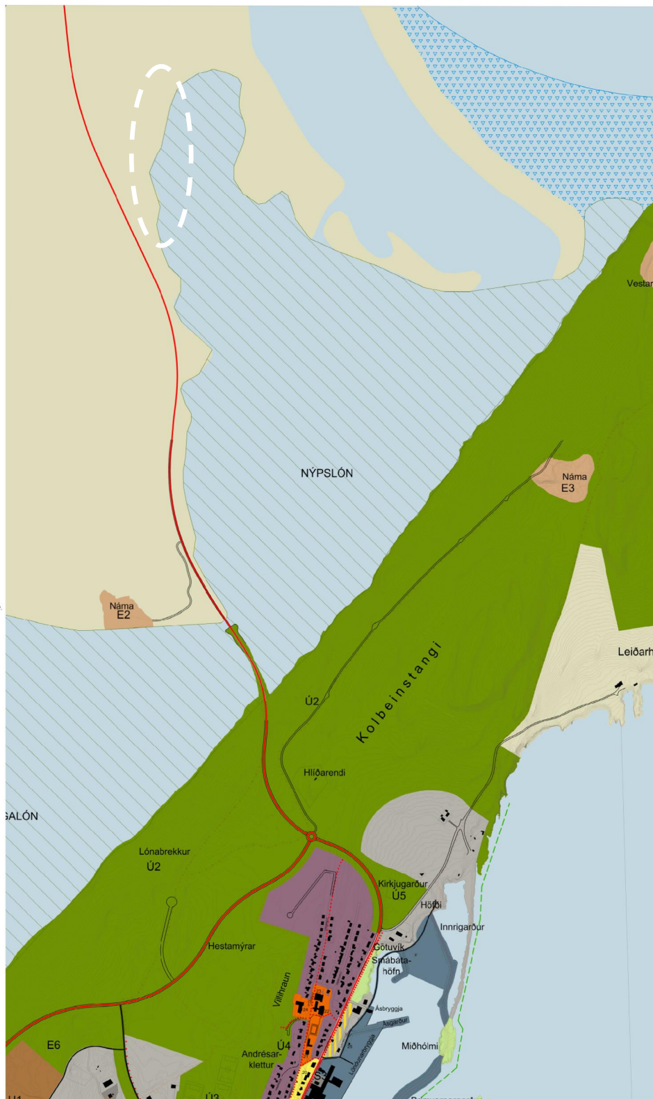
Mynd 2.3 Úr þéttbýlisuppdraetti Aðalskipulags Vopnafjarðarhrepps 2006-2026. Hvítar útlínur sýna hvar Skiphólmi er staðsettur. Beinalón er í ytri hluta Nýpslón. Áætlað áhrifsvæði vegna fuglaskoðunarhúss sýnd með hvítri brotalínu.