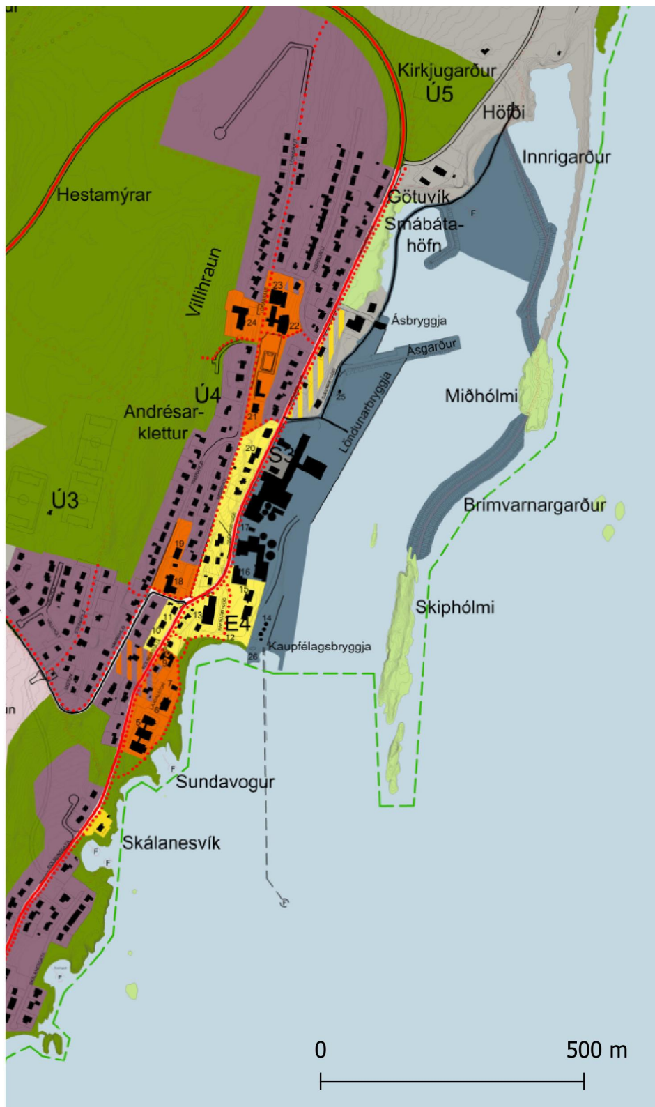
Mynd 4.1. Brot af þéttbýlisuppdrætti sem sýnir miðsvæðið. Fyrir breytingu. Mkv. 1:10.000