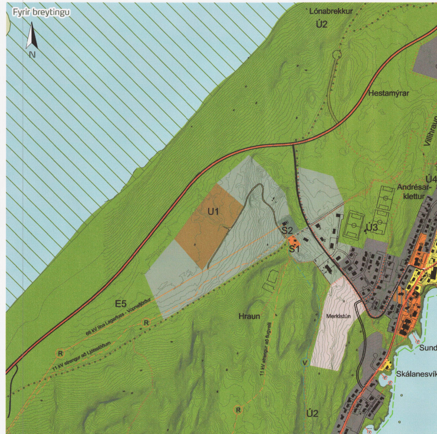
Gildandi aðalskipulag 2006-2026 m.s.br., staðfest af umhverfisráðherra 21.10.2008 mkv. 1:10.000 í A1