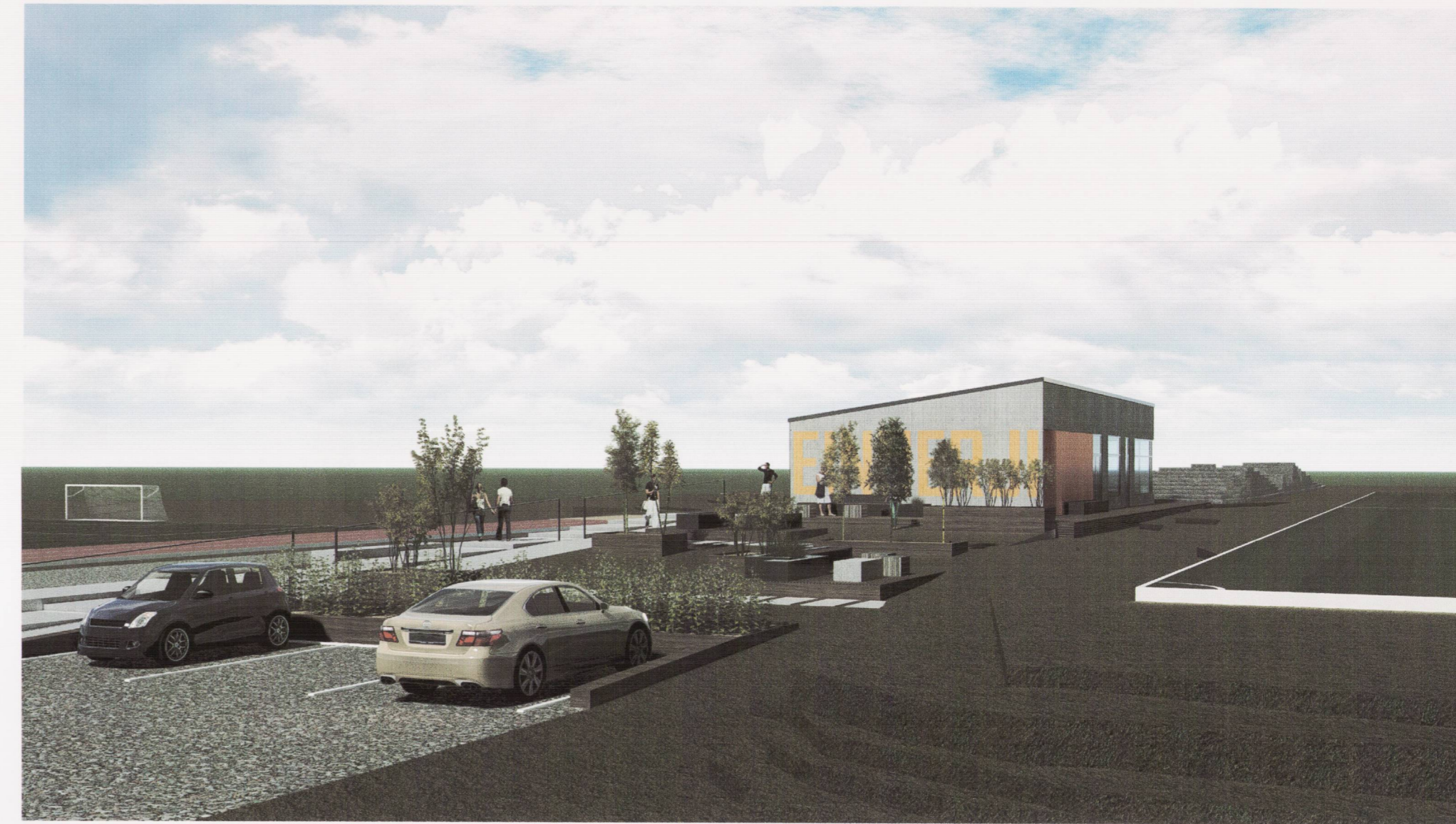
Norður- og vesturhlíðar vollarhúss