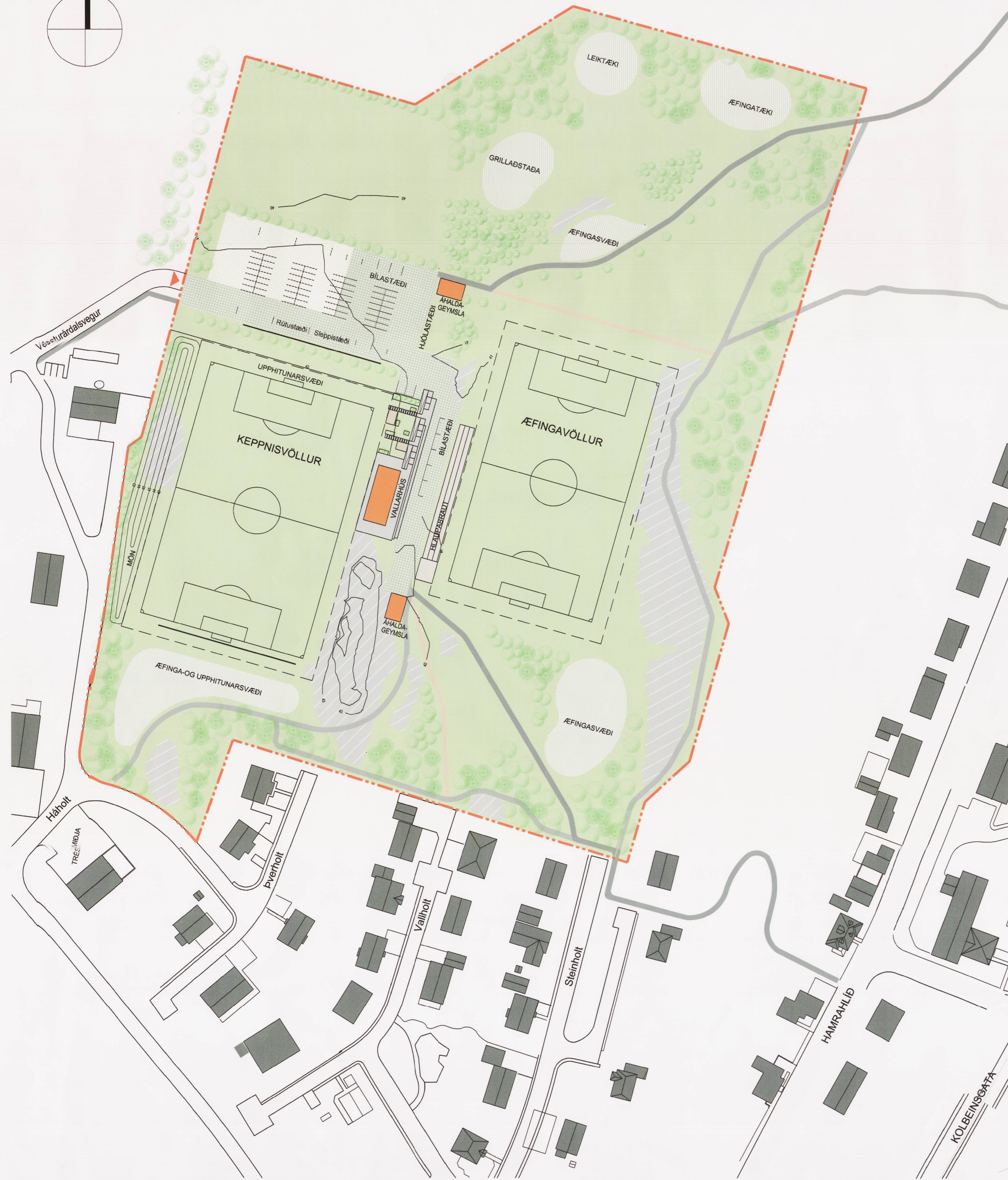
Skýringarmynd við tillögu að deiliskipulagi