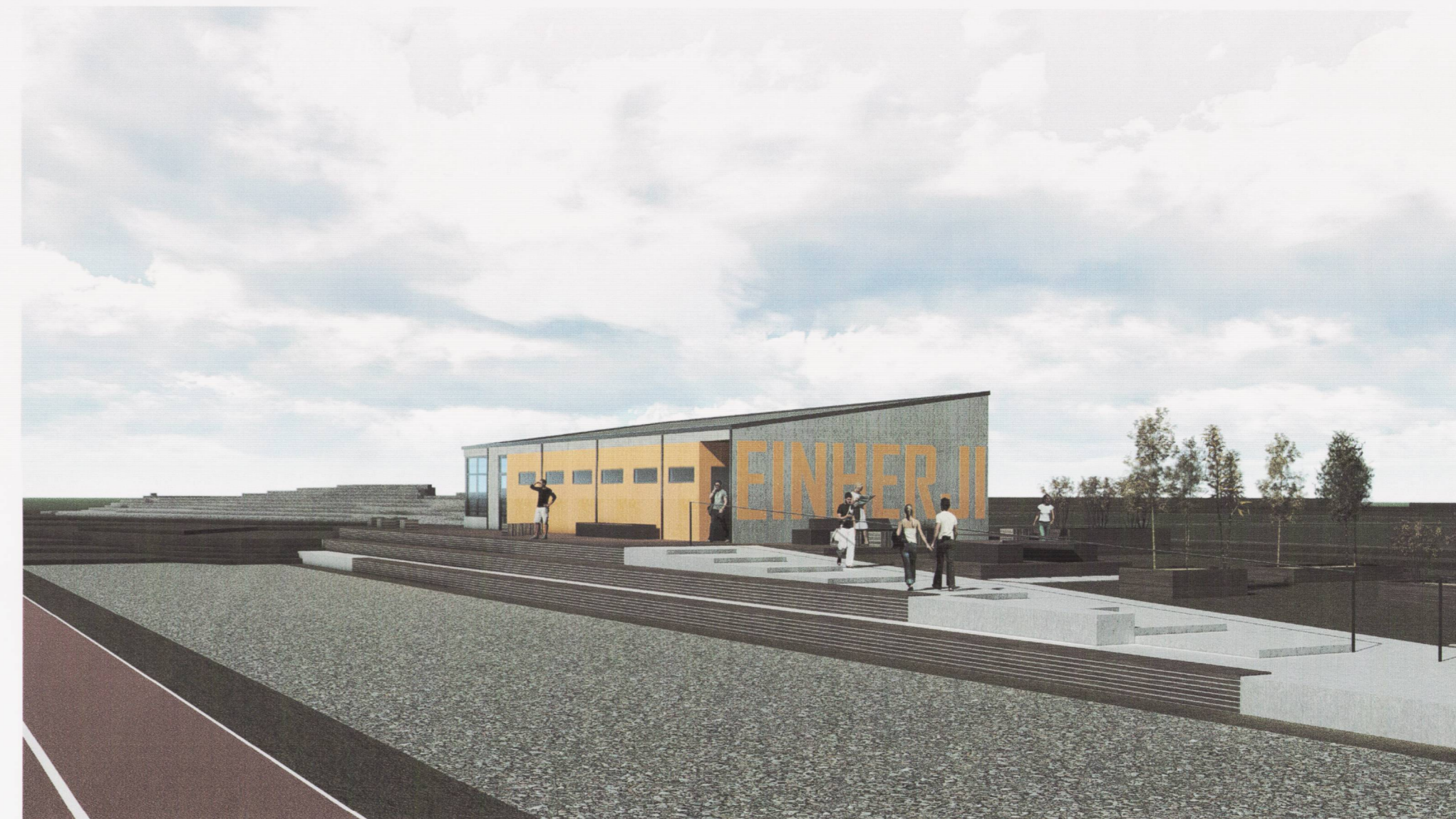
Norður- og austurhlíðar vollarhúss