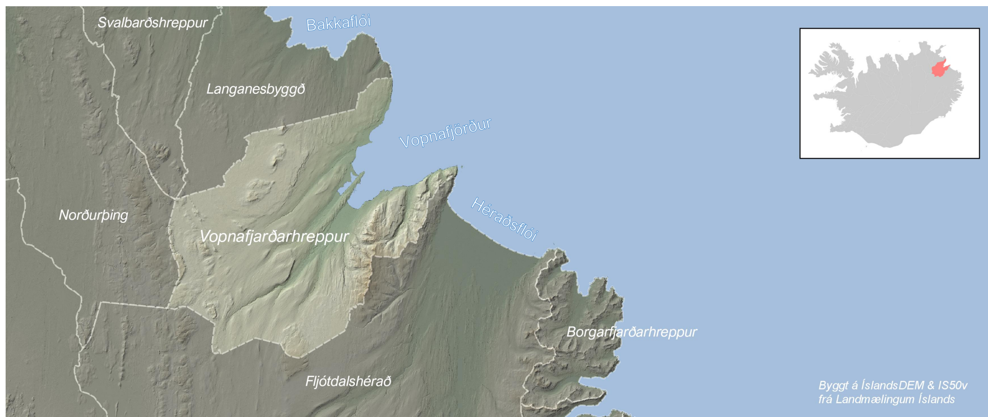
Mynd 3.1 Sveitarfélagsmörk Vopnafjarðarhrepps og aðliggjandi sveitarfélög.

Við stefnumótun verður þó einnig horft út fyrir skipulagssvæðið og horft til annarra áætlana, bæði á landsvísu og svæðisvísu, sem kunna að hafa áhrif á sveitarfélagið. Sjá nánar tengsl við aðrar áætlanir í næsta kafla.