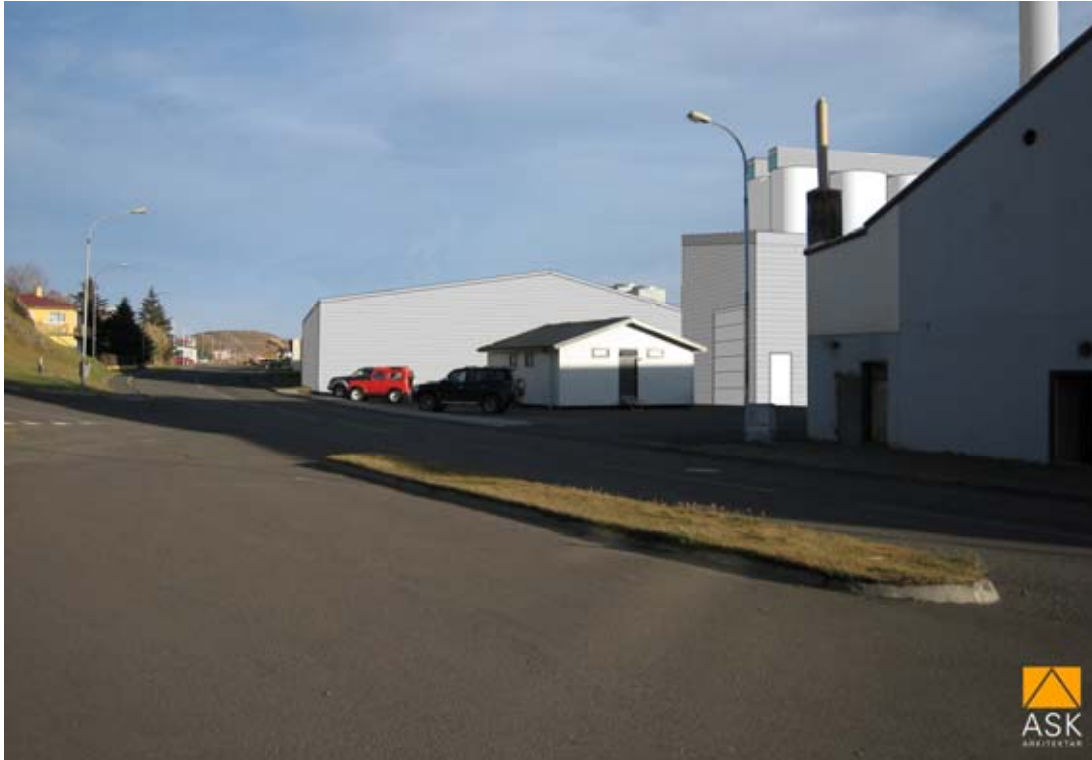
Mynd 6. Skýringarmynd frá HB Granda. Áætlað útlit mannvirkja séð frá Hafnarbyggð, til norðausturs.