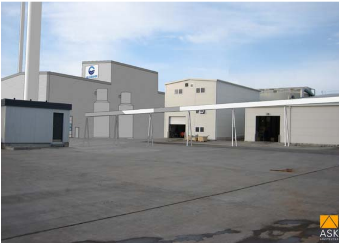
Mynd 12. Skýringarmynd frá HB Granda. Áætlað útlit mannvirkja séð frá hafnarsvæði til norðvesturs