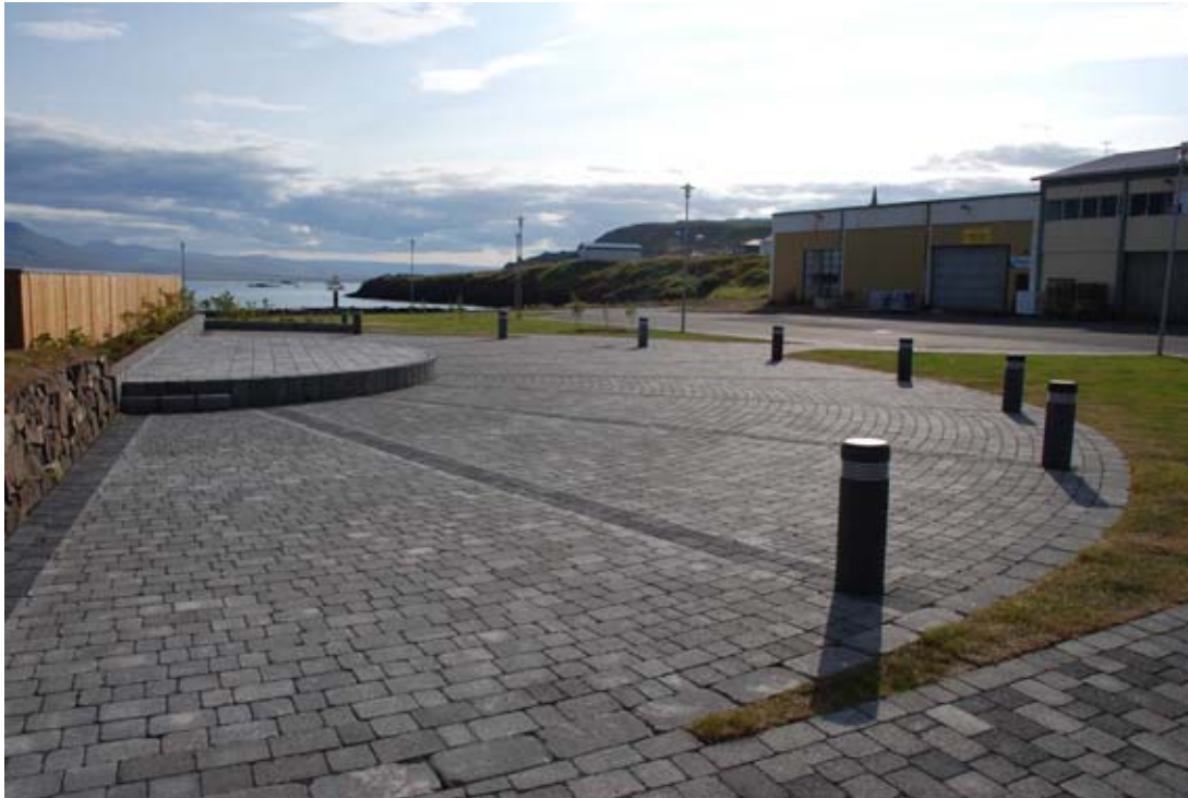
Mynd 5. Miðbæjarsvæði með uppbyggðri senu og ný-gróðursettum beðum.

Gert er ráð fyrir 8 bílastæðum fyrir almenning norðarlega á skipulagssvæðinu. Þá eru almenn bílastæði á miðbæjarsvæðinu auk stæða fyrir stóra bíla. Þar eru skilgreind 3 bílastæði fyrir hreyfihamlaða. Þá er gert ráð fyrir almennum bílastæðum fyrir allt að 10 bíla austan Kaupvangs og á hafnarsvæði austan verksmiðju. Einnig verður gert ráð fyrir 7 bílastæðum við Hafnarbyggð 12.