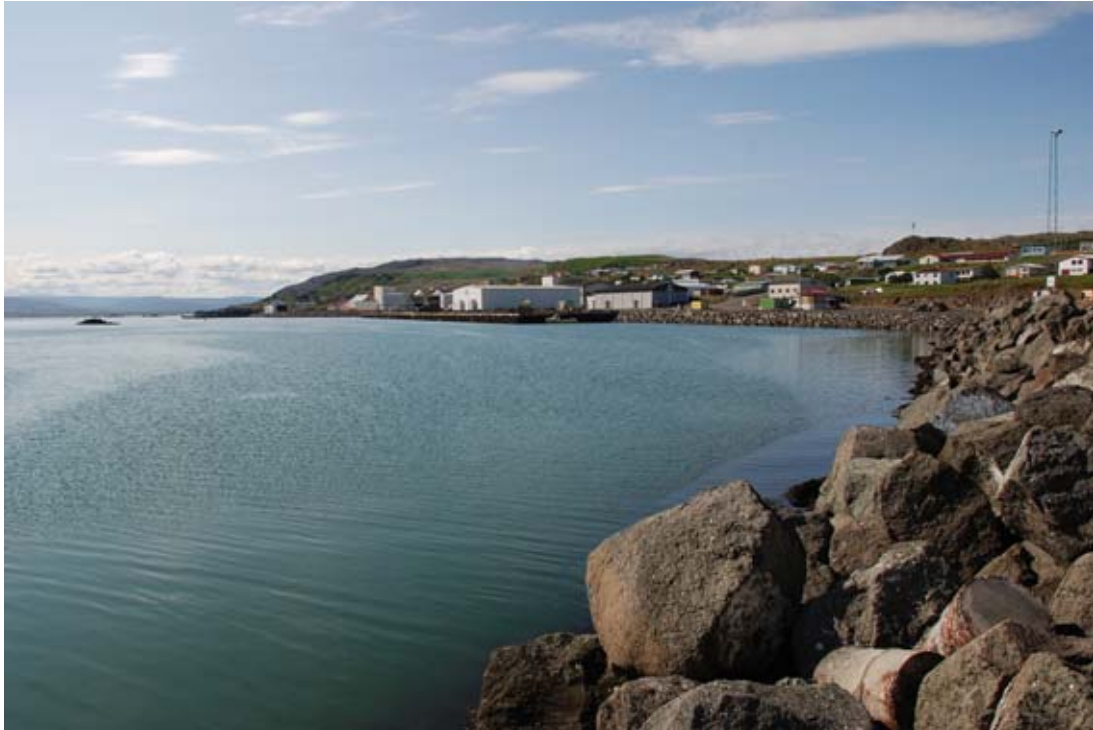
Mynd 1. Horft frá Ásgarðsbryggju til suðurs yfir hafnarsvæðið.

Auk ofangreinds er á svæðinu húsnæði þar sem rekin var fiskmarkaður til skamms tíma og ofan verslunarhúsnæðis og vörumóttöku var rekin mjólkurstöð. Bæði húsnæðin standa auð í dag.