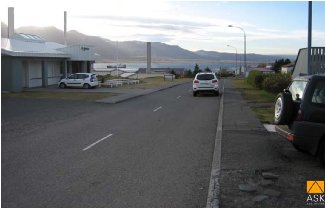
Mynd 11. Skýringarmynd frá HB Granda. Áætlað útlit mannvirkja séð frá Lónabraut til suðurs.