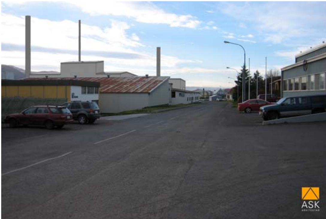
Mynd 14. Skýringarmynd frá HB Granda. Áætlað útlit mannvirkja séð frá Hafnarbyggð, til suðurs.