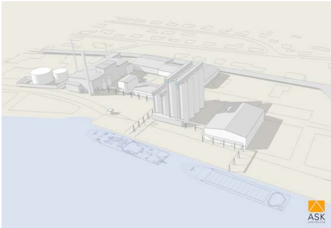
Mynd 7. Skýringarmynd frá HB Granda. Heildarsvæði HB Granda.