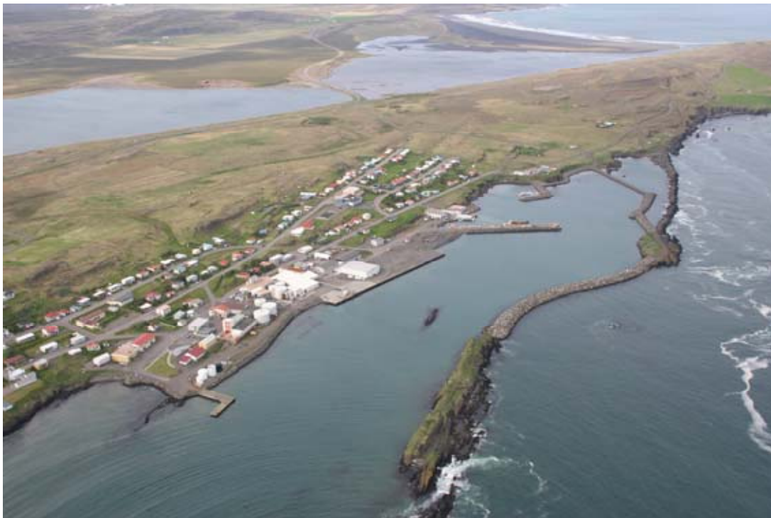
Mynd 6. Hafnar- og miðsvæði ð ásamt aðliggjandi svæðum. Séð úr lofti, júní 2008.

Í reglugerð nr. 785/1999 um starfsleyfi fyrir atvinnurekstur sem getur haft í för með sér mengun er í fylgiskjöllum 1 og 2 talið upp hvort starfsleyfi fyrirtekis sé í höndum viðkomandi heilbrigðisnefndar eða Umhverfisstofnunar. Fyrir aðra atvinnustarfsemi í húsum þar sem það er heimilt skal rekstraraðili afla starfsleyfis heilbrigðisnefndar í samræmi við lög um hollustuhætti og mengunarvarnir nr. 7/1998 m.s.br.