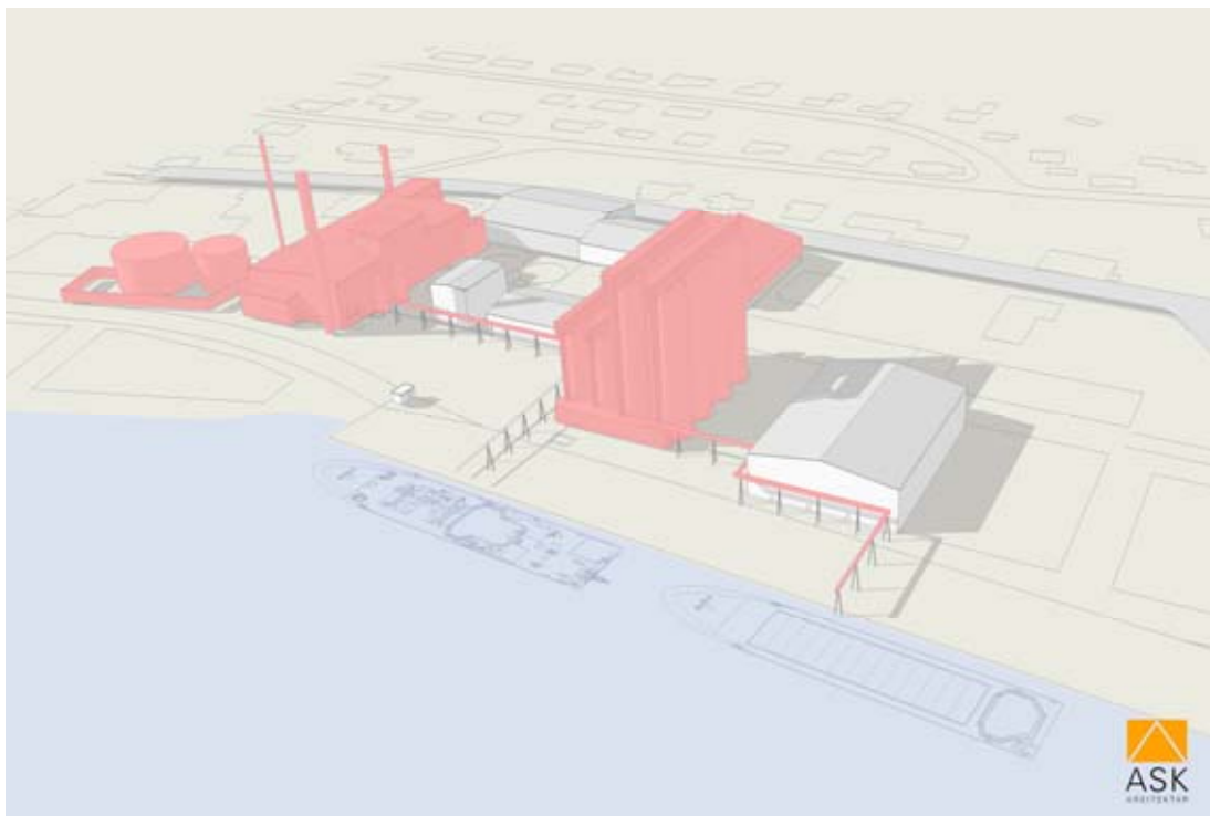
Mynd 8. Skýringarmynd frá HB Granda. Ný mannvirki lituð.