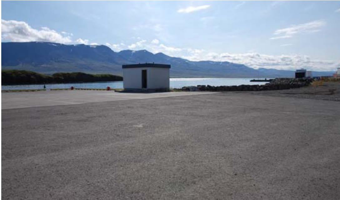
Mynd 2. Dæluhús verður flutt að verksmiðjuvegg.