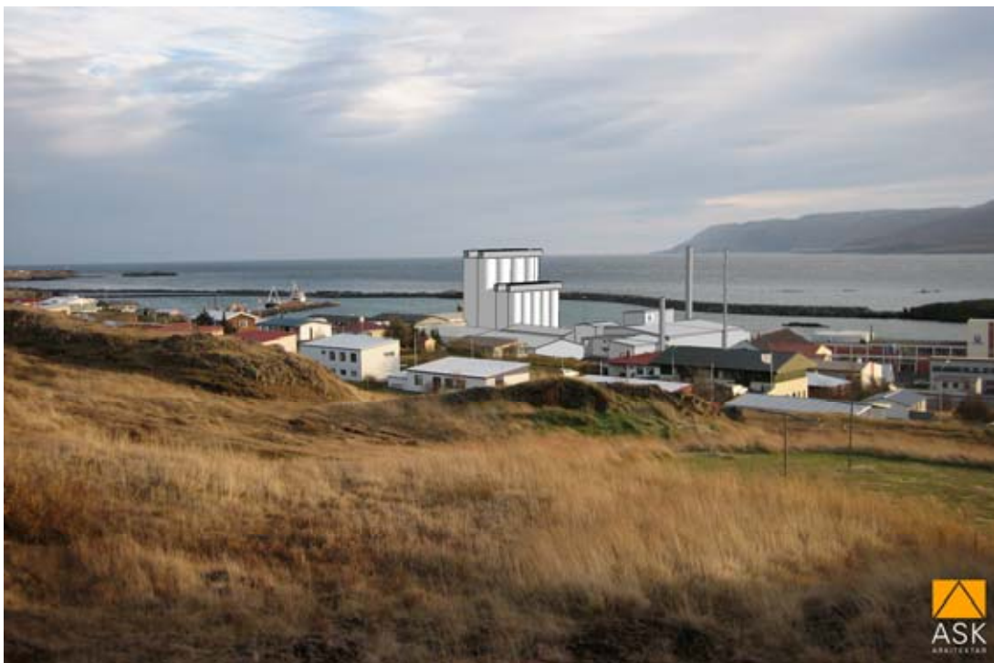
Mynd 10. Skýringarmynd frá HB Granda. Byggingarreitur nýrrar verksmiðju. Hérna megin stóra tanksins og inní portið.