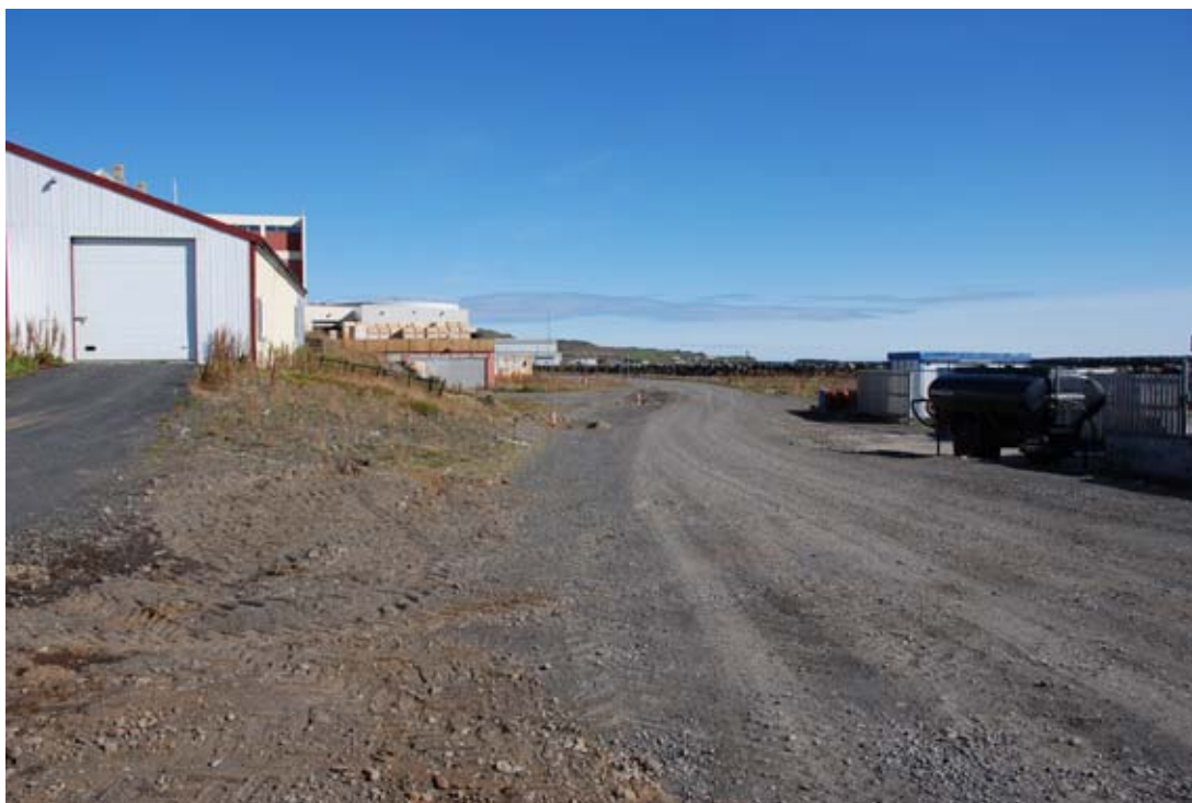
Mynd 4. Aðkoma að hafnarsvæði frá suðri.

Nýjar stórar byggingar og skorsteinar verða staðsettar neðst á hafnarsvæðinu til að draga úr hæð þeirra í landi og sjónrænum áhrifum frá byggð. Við hönnun þeirra skal leitast við að fella mannvirki að öðrum byggingum svæðisins, varðandi þakhalla og ytra útlit.