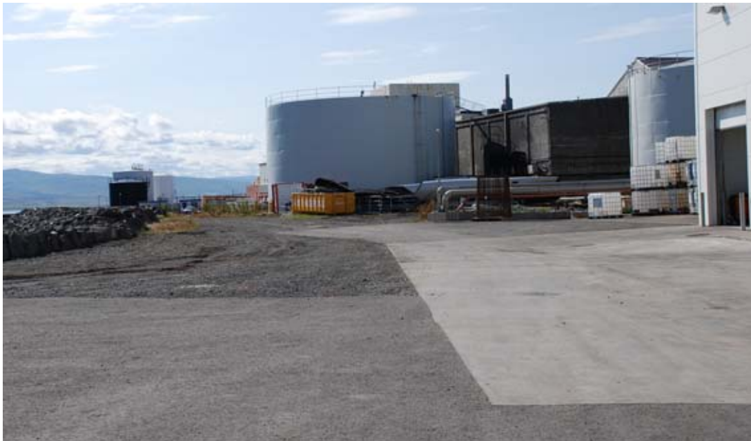
Mynd 3. Byggingarreitur nýrrar verksmiðju. Hérna megin stóra tanksins og inní portið.

Lýsistankur norðan sláturhúss verður fjarlægður. Þá er gert ráð fyrir að olíubirgðastöð flytji sig frá núverandi svæði til norðurs. Dæluhús við hafnarkantinn verður flutt að verksmiðjuvegg. Viðbygging sunnan og austan á núverandi verksmiðju verður rifin og norðurendi núverandi verksmiðjuhúss verður endurbyggður. Á deiliskipulagsupprætti eru sýnd þau mannvirki sem heimilað er að fjarlægja.