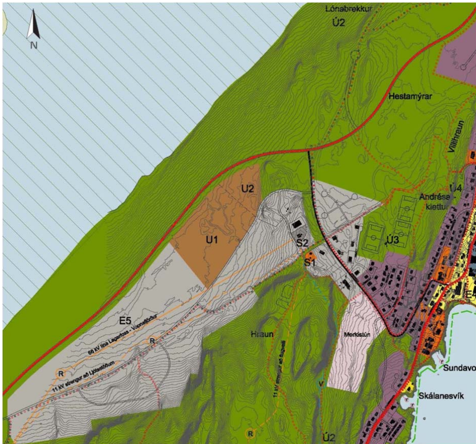
Tillaga að breytingu á Aðalskipulagi Vopnafjarðar 2006-2026.